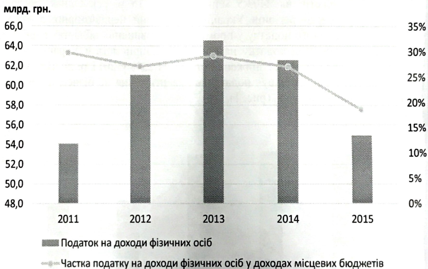
Рис. 2. Динаміка надходжень податку на доходи фізичних осіб до місцевих бюджетів у 2011-2015 рр.

Тому, для підвищення надходжень від податку на прибуток підприємств, доцільно було б здійснювати пільгове оподаткування пріоритетних для відповідної місцевості галузей, з одночасним компенсуванням таких пільг, шляхом розширення прав органів місцевого самоврядування в частині надання можливості встановлювати надбавки до податку на прибуток для решти підприємств, що створює конкурентні умови між територіальними громадами. Це дозволить, у майбутньому, не лише поліпшити бізнес-клімат регіону, але й дасть поштовх до створення нових робочих місць, що збільшить надходження від податку на доходи фізичних осіб, який на даний час, є основою формування місцевих бюджетів (рис. 2).