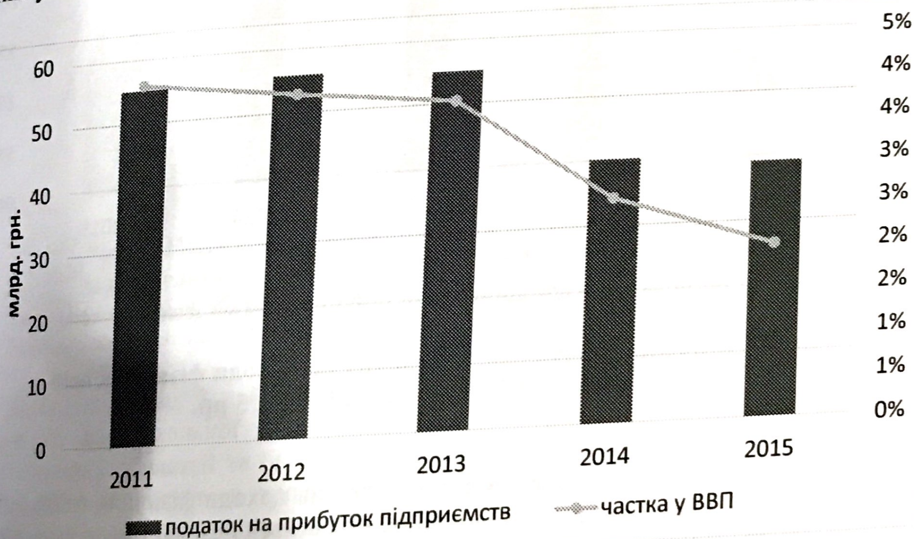
Рис. 1. Динаміка надходжень податку на прибуток підприємств до зведеного бюджету України за 2011-2015 рр.

Важливим кроком на шляху посилення фінансової достатності органів місцевого самоврядування стало зарахування до місцевих бюджетів 10% надходжень від податку на прибуток підприємств, що збільшило надходження до місцевих бюджетів на 2403,5 млн. грн. у 2015 р. [1]. Однак, розподіл підприємств у розрізі регіонів України здійснений нерівномірно, а отже, і надходження від даного податку у промислово розвинених областях вищі. При цьому, надходження від податку на прибуток підприємств в Україні щороку зменшується, зокрема, через зниження ставки із 23% у 2011 р. до 18% у 2014 р., що з одного боку, зменшує податкове навантаження на бізнес, а з іншого, знижує його фіскальну роль (рис. 1).