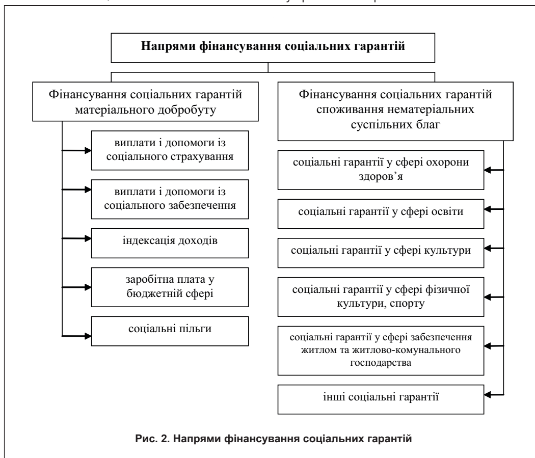
Рис. 2. Напрями фінансування соціальних гарантій

печення. Водночас, у державі повинні бути створені умови для споживання суспільних благ і послуг на рівні, вищому від гарантованого, а також якіснішого змісту.