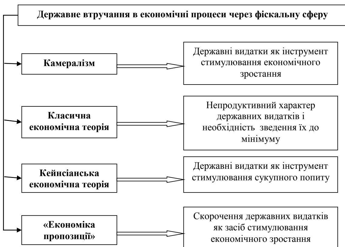
Рис. 1. Наукові підходи економічних шкіл до ролі державних видатків у забезпеченні економічного зростання

Результати. Для з'ясування внеску економічної науки щодо обґрунтування доцільності державного втручання в економічні процеси, зокрема у стимулювання економічного зростання, за допомогою фіскалу, слід розкрити зміст наукових підходів економічних шкіл (рис. 1).