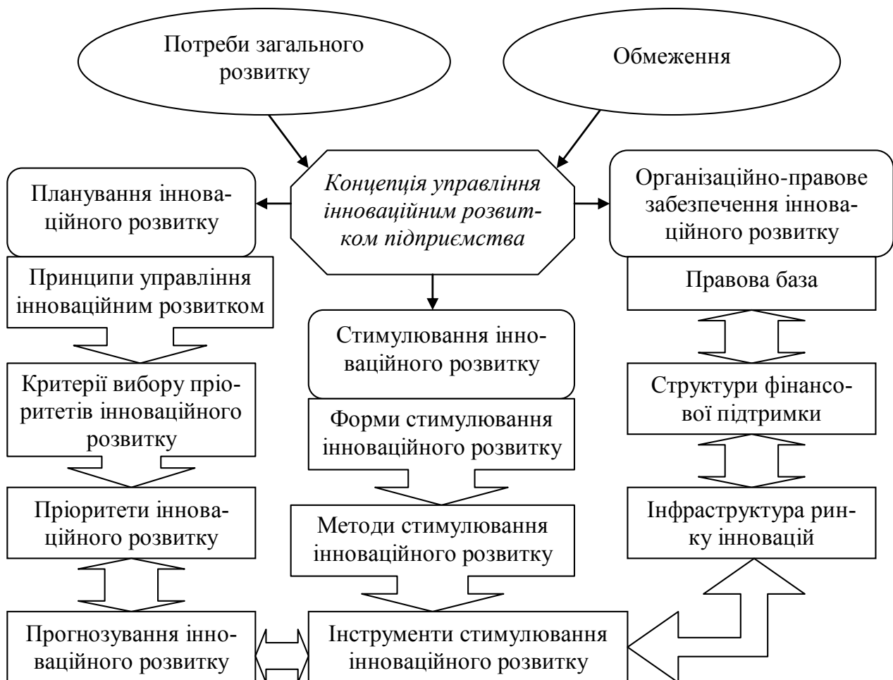
Рис. 3. Загальна схема формування і реалізації концепції управління інноваційним розвитком підприємства

Тому для розробки економічного механізму інноваційного розвитку підприємств ми вважаємо за доцільне розробити концепцію управління інноваційним розвитком підприємства, яка враховує інноваційну культуру та потенціал підприємства, потреби суспільного розвитку та обмеження, що пов'язані з використанням всіх наявних ресурсів (рис. 3).