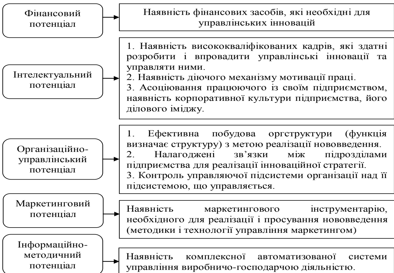
Рис. 2. Структура інноваційного потенціалу, необхідного для створення нових механізмів просування продукції на ринок, пошуку нових ринків і сфер споживання продукції (ринкові інновації)

Дана структура інноваційного потенціалу враховує кадрові інновації, що направлені на формування стратегії управління трудовими ресурсами з метою підвищення їх кваліфікації та культури виробництва. З іншого боку, з'являється можливість наповнити конкретним змістом кожен чинник і вийти на розробку типових моделей організаційного, правового, технологічного формування інноваційного потенціалу підприємства з урахуванням галузевих і регіональних особливостей. Може йтися, наприклад, про завдання, структуру і організацію діяльності служб експертизи або патентування. Нами запропонована структура інноваційного потенціалу підприємства, яка необхідна для пошуку нових ринків, нових механізмів виведення продукції на нові ринки, тобто використання ринкових інновацій (рис. 2).