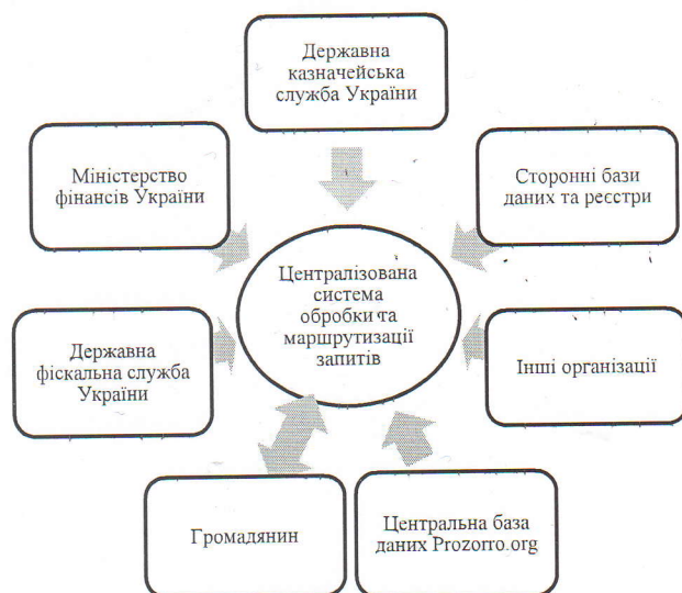
Рис. 1. Схема функціонування інформаційно-аналітичної системи «Прозорий бюджет»

Доцільно зазначити, що за останні роки Україна демонструє пониження Індексу відкритості бюджету, котрий розраховується за 100-бальною шкалою згідно досліджень Міжнародного бюджетного партнерства. Дослідження базується на 109 показниках для визначення прозорості бюджету, котрі визначають доступність для суспільства головних бюджетних документів, їх всеохоплюючий та корисний характер. Так, в 2015 році Індекс відкритості бюджету в Україні становив 46 балів, що означає надання обмеженої інформації про бюджет для суспільства, та зменшився порівняно з 2008 роком на 9 балів [19]. Якщо середній світовий показник у 2015 році становив 45 балів, то Україна порівняно з країнами визначеного регіону зайняла передостаннє