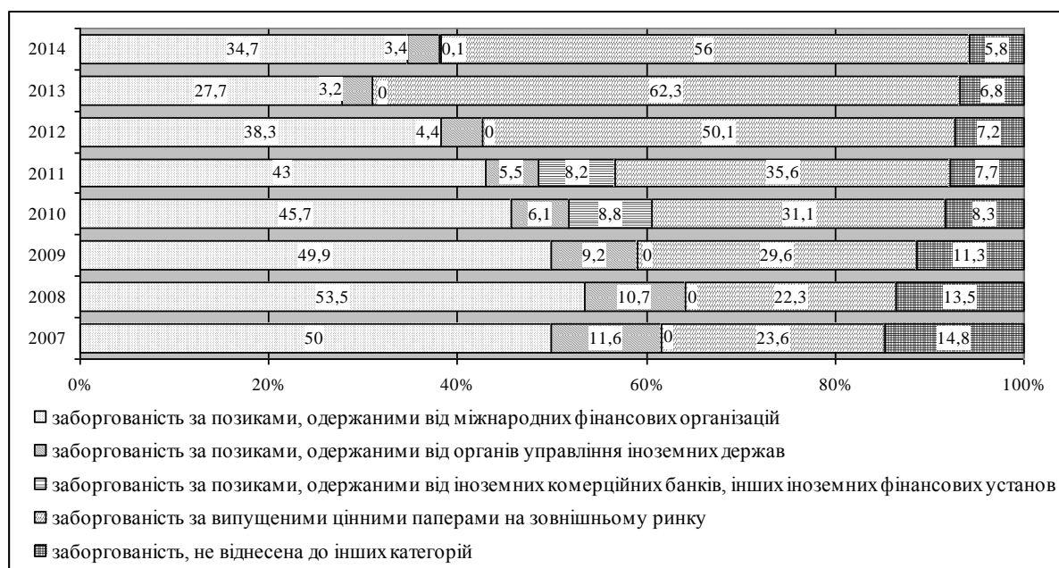
Рис. 3. Зовнішня заборгованість України за видами позик у 2007-2014 роках

у 2011 році скоротилась на 7% в порівнянні з 2007 роком. Максимальне значення даного показника спостерігалось у 2008 році – 53,3%, а мінімальне у 2013 році – 27,7%. Проте, стрімко зростає питома вага заборгованості за випущеними цінними паперами на зовнішньому ринку – з 23,6% у 2007 році до 62,3% у 2013 році, і лише у 2014 році вона зменшується на 6,3% в порівнянні з попереднім роком. Протягом восьми років суттєво скорочується частка заборгованості за позиками, одержаними від органів управління іноземних держав (на 8,2 %) та заборгованості, не віднесеної до інших категорій (на 9 %).