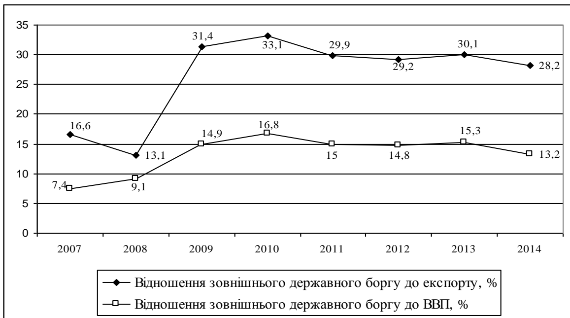
Рис. 2. Відношення зовнішнього державного боргу до ВВП та експорту товарів і послуг у 2007-2014 роках

продукту зменшився, проте залишався досить високим для посилення боргової стійкості держави. Водночас, відношення зовнішнього боргу до експорту товарів і послуг було низьким лише у 2007-2008 роках – 16,6 % та 13,1% відповідно, проте високі значення даного показника у 2009-2014 роках (близько 30%) вказують на значну неплатоспроможність України. При цьому, структура експорту України із високою питомою вагою сировинної складової створює ризики девальвації національної валюти в процесі стимулювання розвитку окремих галузей. Економіка такого типу є чутливою до змін на світовому ринку, негативні тенденції зміни цін приводять до зменшення експорту та створюють додатковий тиск на курс гривні.