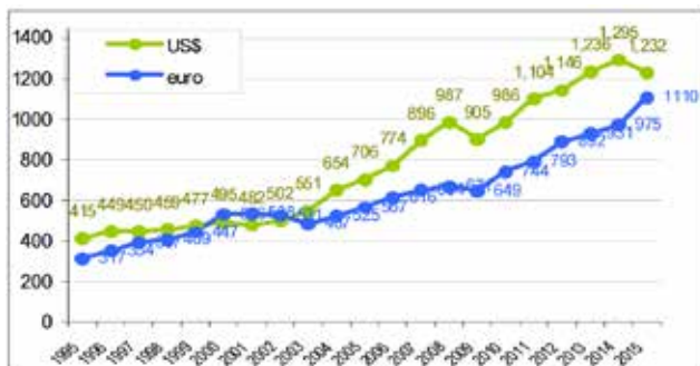
Рис. 2. Дохід країн від міжнародного туризму 2000–2015 рр., млрд. дол. США

Безперечно, зростання обсягів міжнародного туризму веде до зростання туристичних витрат та доходів від міжнародного туризму. Темпи зростання цього показника в 2011 р. становили 11%, у 2012 р. – 5%, у 2013 р. – 7,5%, у 2014 р. – 10%, а у 2015 р. – 3,6%, що свідчить про тенденцію збільшення витрат кожного туриста на подорожі (див. рис. 2).