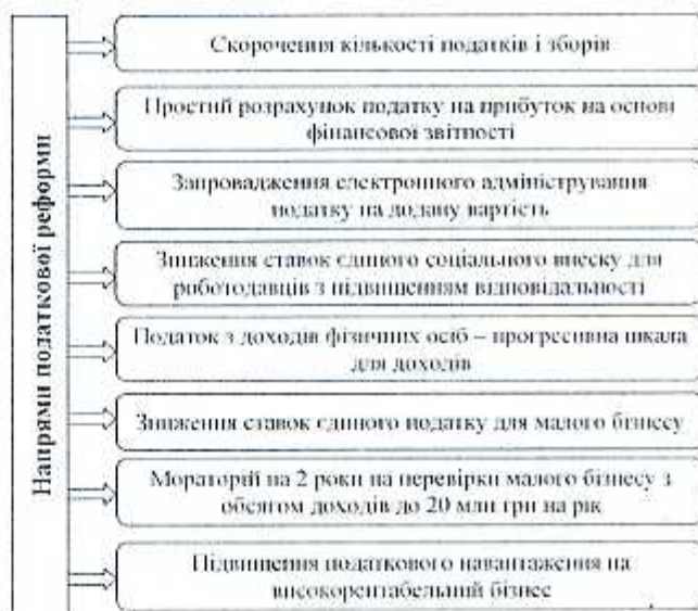
Рис. 1. Напрями податкової реформи в Україні

Відповідно до Стратегії сталого розвитку «Україна-2020», мета податкової реформи – побудова податкової системи, яка є простою, економічно справедливою, з мінімальними затратами часу на розрахунок і сплату податків, створює необхідні умови для