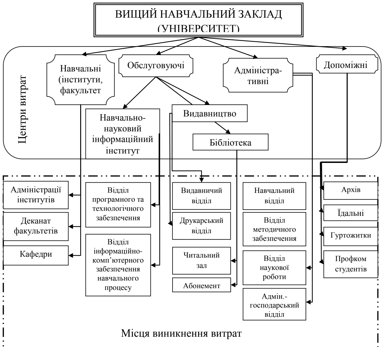
Рис. 3. Структура центрів витрат та місць їх виникнення у вищому навчальному закладі

Виходячи із вище сказаного та структури вищого навчального закладу, можна виділити центри витрат та місця їх взаємозв'язку (рис. 3).