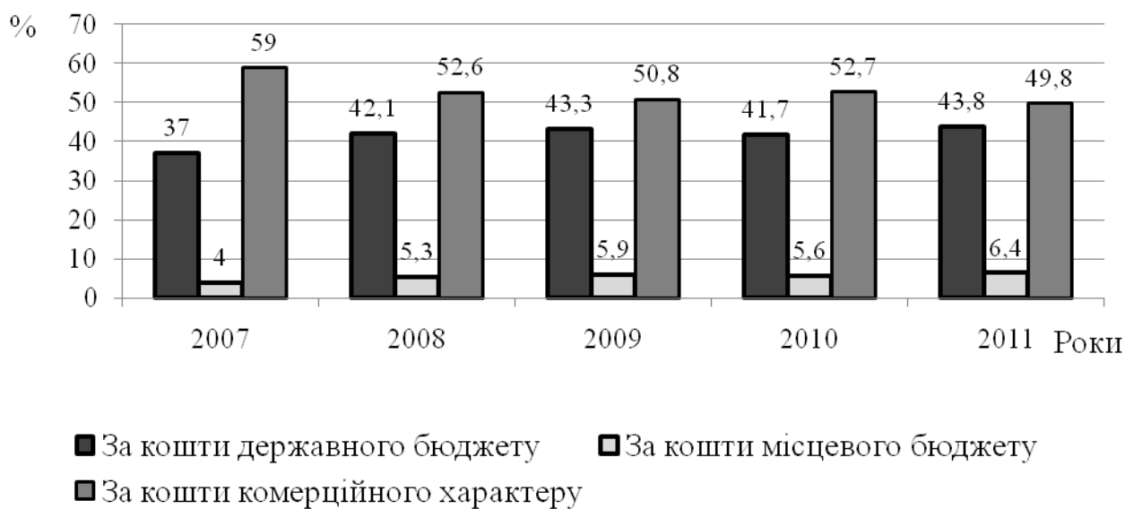
Рис. 2. Фінансування навчання у вищих навчальних закладах за 2007-2011 роки

поєднання у вищих навчальних закладах бюджетного фінансування та комерційної діяльності (рис. 2).