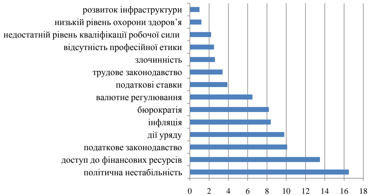
Рис. 2. Характеристика факторів, що заважають розвитку бізнесу в Україні