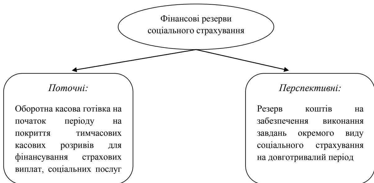
Рис. 1. Склад фінансових резервів державного соціального страхування 1

Практика функціонування державних цільових фондів свідчить про утворення фінансових резервів у двох формах: оборотної касової готівки та залишку коштів на початок бюджетного періоду. Виходячи з цього, фінансові резерви соціального страхування розглядаються нами як поточні та перспективні.