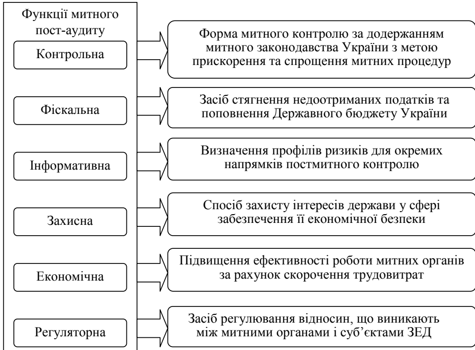
Рис. 1. Функціональне призначення митного пост-аудиту [3]

Відповідно до законодавства та досвіду країн Європейського Союзу митний пост-аудит спрямований на [12]: