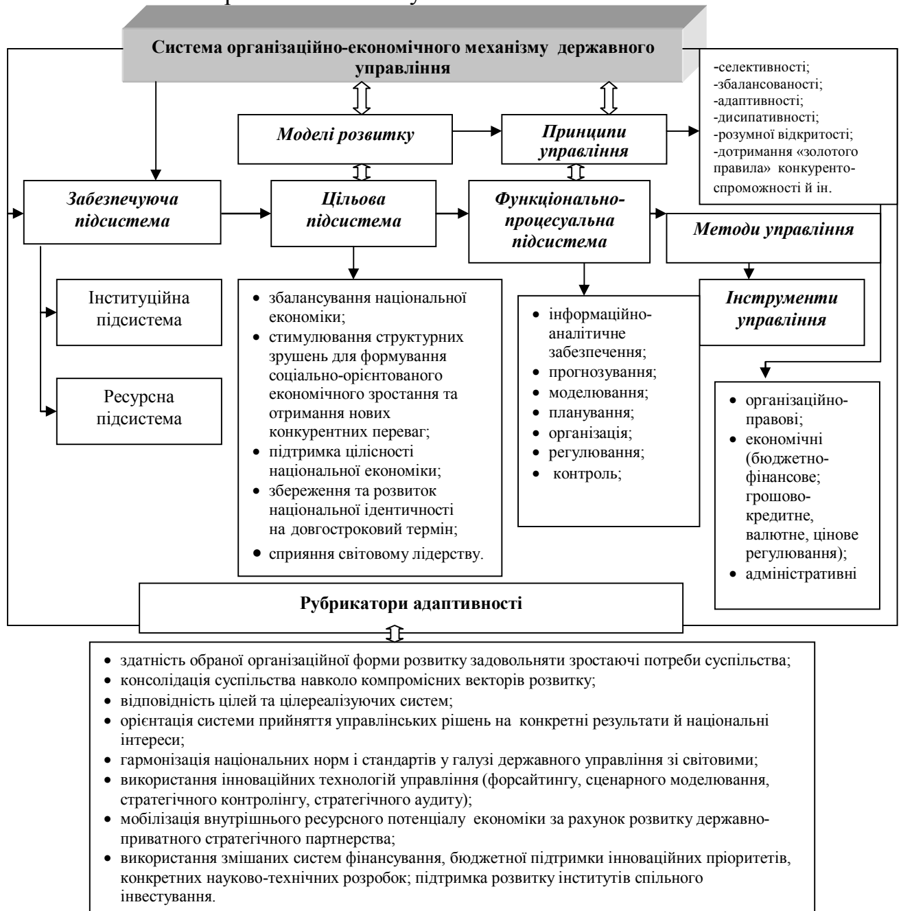
Рис. 1. Організаційно-економічний механізм управління довгостроковим розвитком України

забезпечення, нестача механізмів захисту національних стратегічних інтересів, низька ефективність реалізації державних стратегій, відсутність належного правового інструментарію взаємоузгодження національних і наднаціональних інтересів, слабкість комунікацій між владою та суспільством, недостатньо ефективна система квазіринкового впливу.