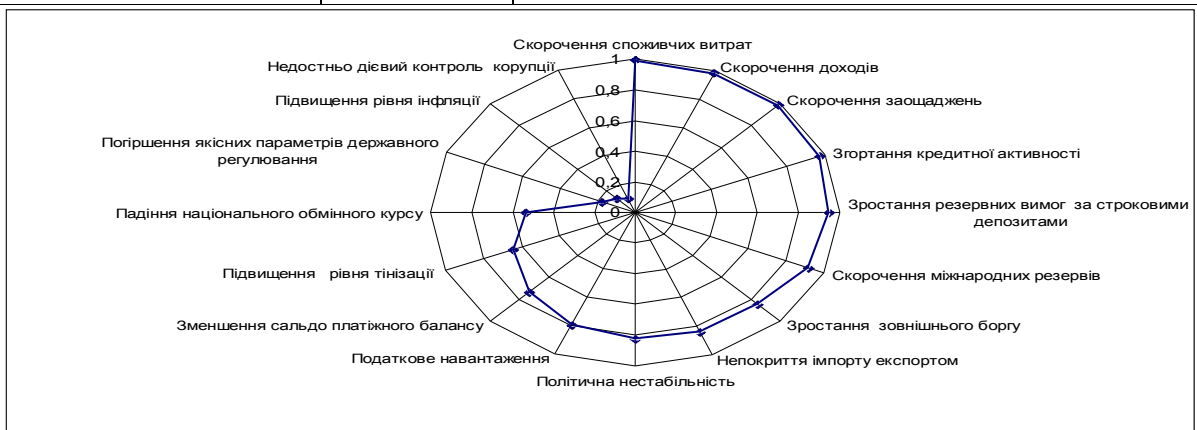
Рис. 2. Еннеограма впливу ризиків розвитку інституційних секторів на динаміку ВВП України