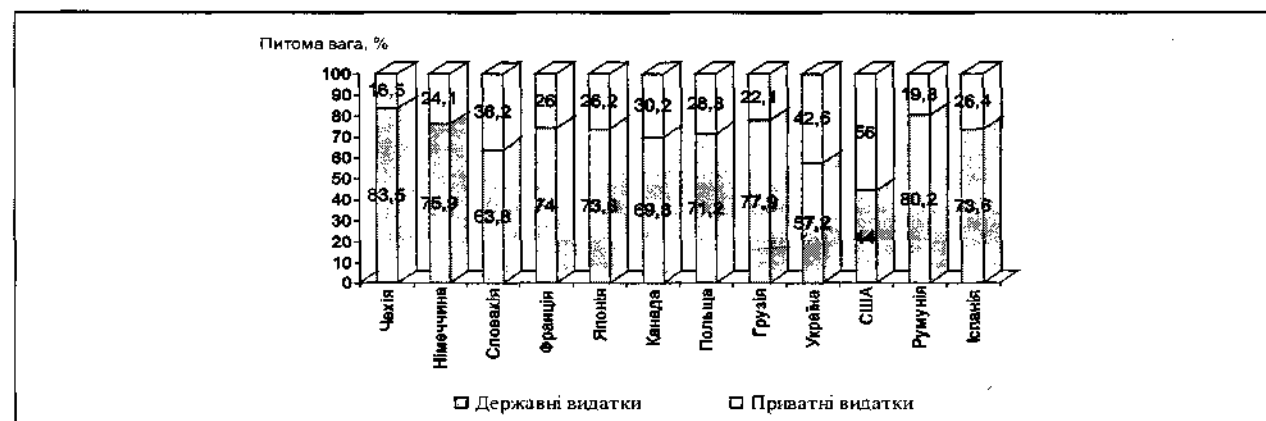
Рисунок 2. Джерела фінансування охорони здоров'я в Україні та зарубіжних країнах у 2011 році, %

Наведені статистичні дані дають підставу припустити, що в Україні де-юре бюджетна модель організації та фінансування охорони здоров'я, яка дісталася нашій державі у спадок від існуючої в СРСР моделі Семашко, де-факто трансформується в систему, яка поєднує суспільні та приватні джерела фінансування. Такі зміни супроводжуються зниженням