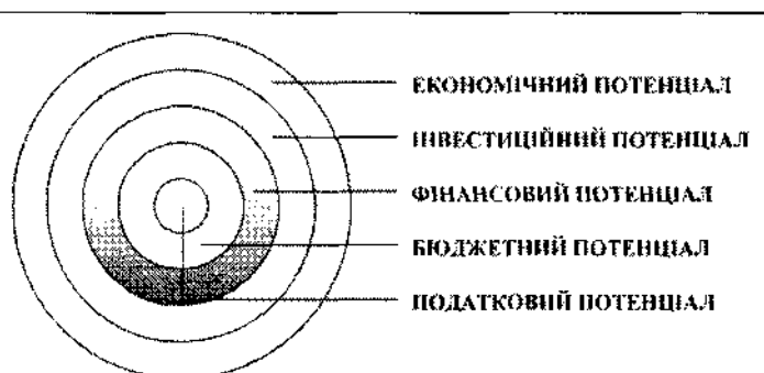
Рис. 1. Фінансовий потенціал у структурно-логічній схемі економічного потенціалу*

Спорідненим до фіскального потенціалу за змістовною сутністю є бюджетно-податковий потенціал, який вітчизняні та російські дослідники трактують по-різному. Зокре-