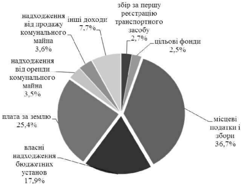
Рис. 4. Доходи від оренди і приватизації комунального майна в структурі власних доходів бюджету м. Тернополя у 2013 р., %