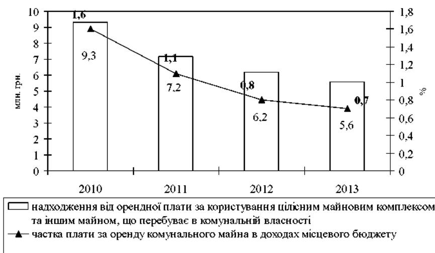
Рис. 1. Динаміка обсягів і частки надходжень від оренди комунального майна в структурі доходів бюджету м. Тернополя

Плата за оренду комунального майна займає друге за фіскальним значенням місце в структурі неподаткових надходжень – майже 16% у 2013 р. і є доволі стабільним і дохідним джерелом доходів, яке потрібно ефективно використовувати органам місцевого самоврядування. Тому, для зміцнення дохідної бази місцевих бюджетів і зростання частки неподаткових надходжень, необхідно створити умови для розвитку і