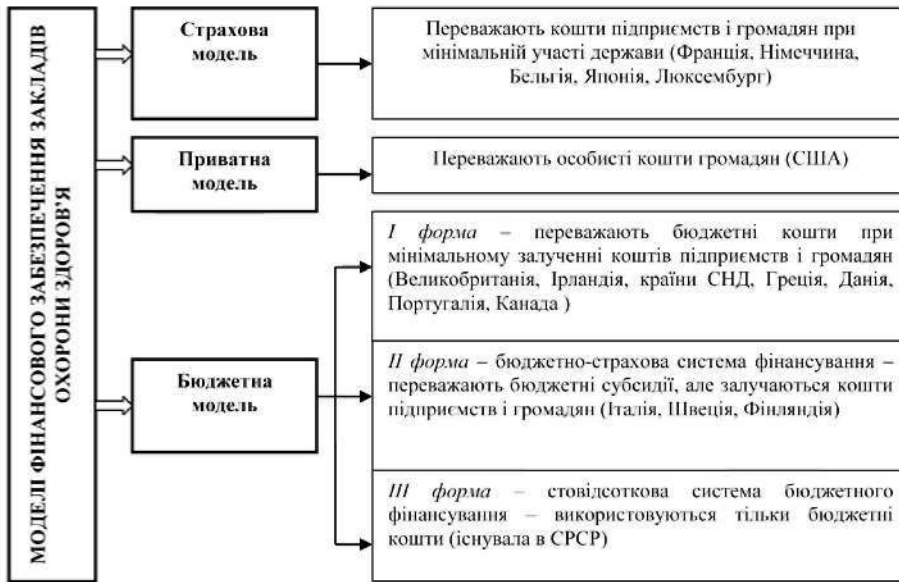
Рис. 2. Моделі фінансового забезпечення закладів охорони здоров'я

нови отримували кошти безпосередньо з бюджету і надавали безкоштовну медичну допомогу населенню.