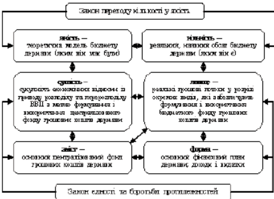
Рис. 2. Взаємозв'язок філософських категорій при дослідженні теоретичних засад бюджету держави

На нашу думку, взаємозв'язок філософських категорій сфер буття і сфери сутності у процесі формулювання теоретичних засад бюджету можна простежити на рис. 2.