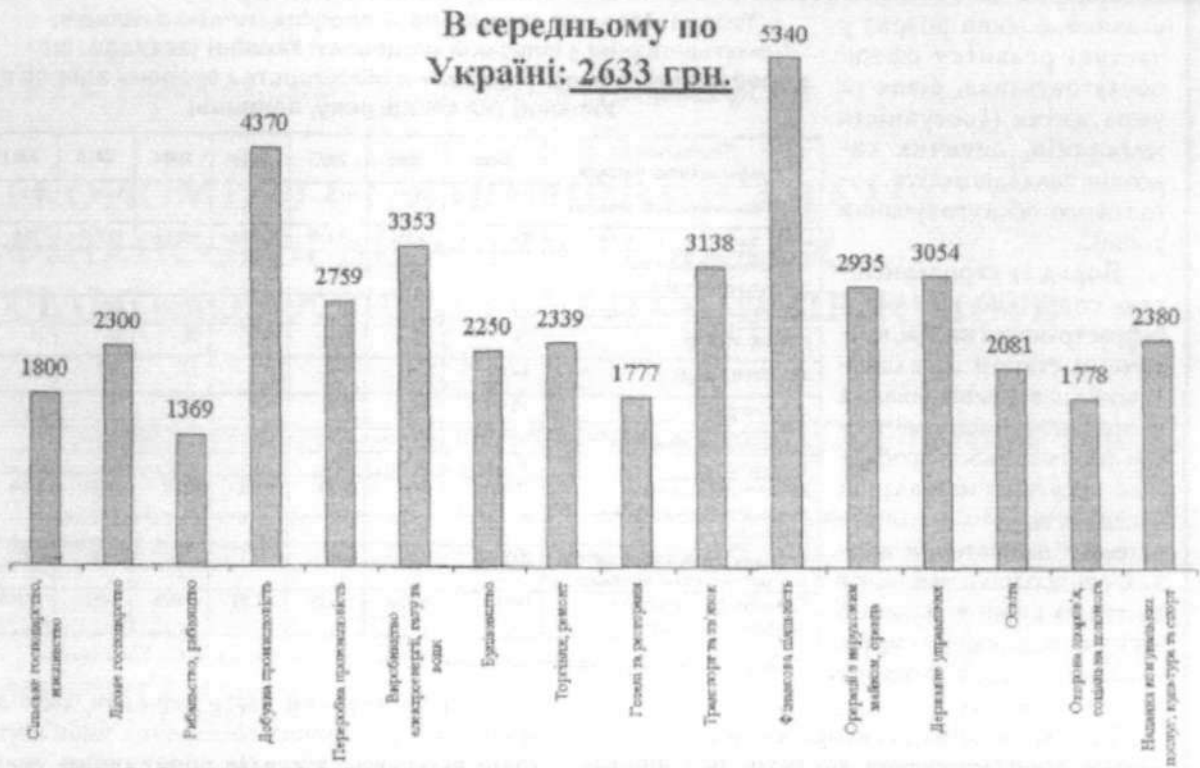
Рис. 2. Середньомісячна заробітна плата штатних працівників за видами економічної діяльності