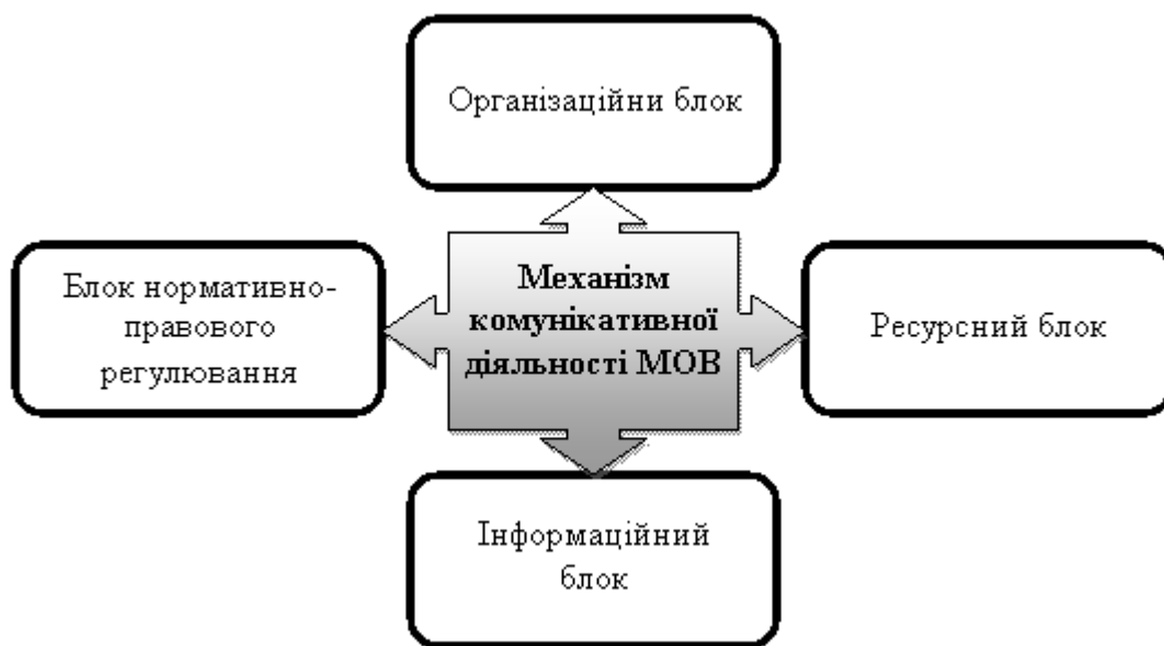
Рис. 1.2. Структурна схема механізму комунікативної діяльності МОВ

Механізм комунікативної діяльності МОВ доцільно розглядати як послідовну реалізацію комплексу правових та організаційних дій, що базуються на основоположних принципах, цільовій орієнтації та використанні відповідних методів управління, спрямованих на задоволення інформаційно-комунікативних потреб населення і організації діяльності структурних підрозділів МОВ. У структурі механізму комунікативної діяльності можна виділити чотири основних блоки: правовий, ресурсний, інформаційний, організаційний (зокрема, цілі управління, елементи об'єкта, методи впливу – принципи) (рис.1.2).