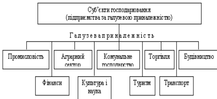
Рис. 3. Класифікація суб'єктів господарювання за галузевою приналежністю.