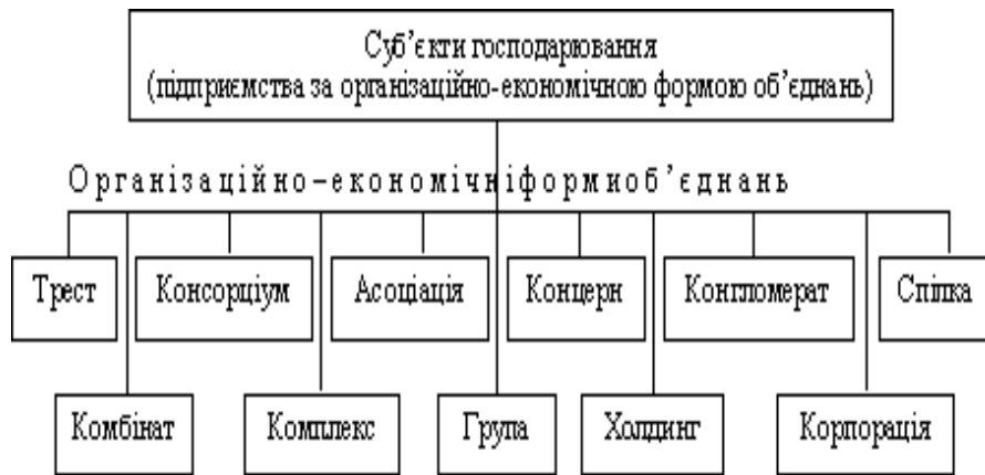
Рис. 2. Класифікація суб'єктів господарювання за організаційно-економічною формою об'єднання підприємств.