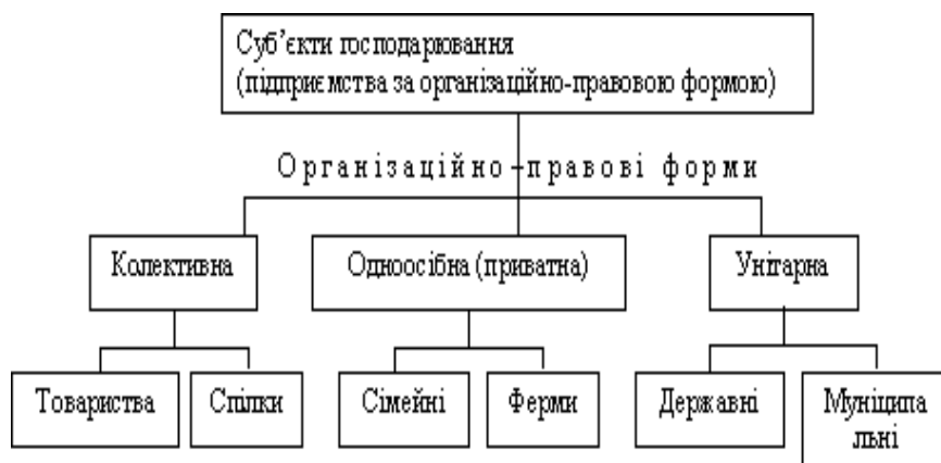
Рис. 1 Класифікація суб'єктів господарювання за організаційно-правовою формою.

У економічній літературі подано класифікацію суб'єктів господарювання за різними класифікаційними ознаками, котрі представлено на рисунках нижче: