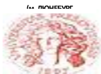
МІЖНАРОДНА ШКОЛА МЕНЕДЖМЕНТУ У ПРЯШЕВІ (СЛОВАКІЯ)