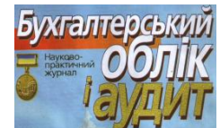
ЖУРНАЛ "БУХГАЛТЕРСЬКИЙ ОБЛІК І АУДИТ"