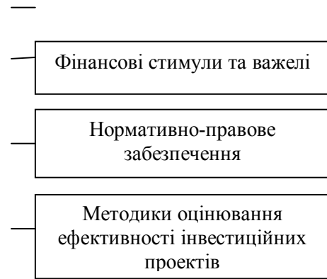
Рис. 1. Механізм фінансового забезпечення інвестиційної діяльності суб'єктів територіальних господарських утворень

Висновки. Підсумовуючи викладене вище, зазначимо, що трансформаційні перетворення, які супроводжуються демократизацією суспільного життя, зростанням попиту на фінансові ресурси й наявністю відставання в їх пропозиції, ускладнюють фінансові відносини, зумовлюють запровадження преференційних режимів інвестиційної діяльності суб'єктів господарювання. За таких умов реалізація останнього потребує функціонування відповідного фінансового механізму, що характеризується різноманітністю форм і методів мобілізації фінансових ресурсів суб'єктами господарювання, специфікою фінансових стимулів і важелів та методиками оцінювання ефективності інвестиційних проектів.