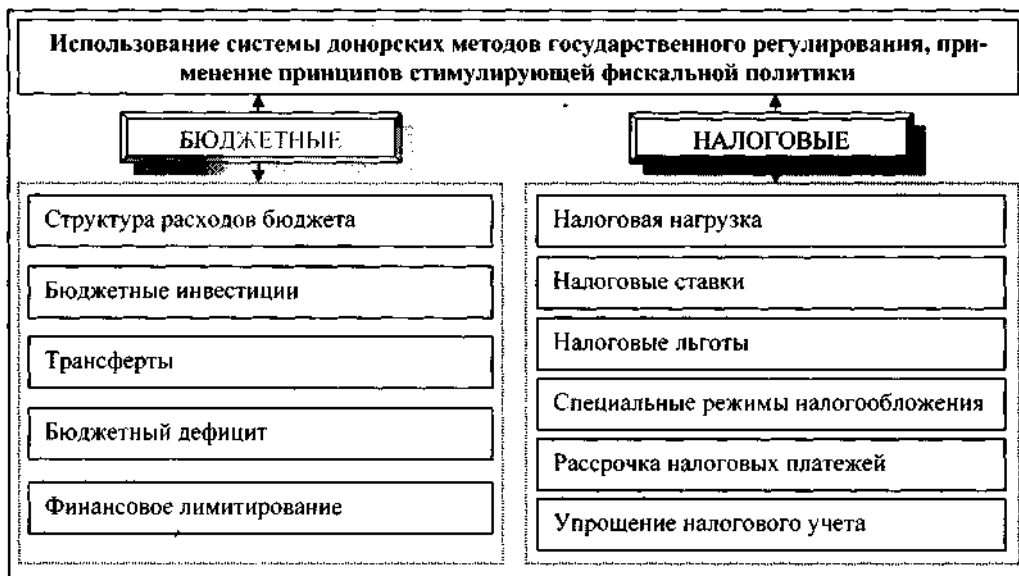
Рис. 1. Инструменты фискального регулирования финансовых процессов

Государственная политика в сфере обеспечения финансово-экономической стабильности в регионе состоит из комплекса управленческих действий в сфере фискального, денежно-кредитного, инвестиционного, социального регулирования и т.п.. К основным фискальным инструментам активизации финансовых процессов в регионе следует отнести налоговые льготы, трансферты, бюджетные инвестиции, налоговые ставки и проч. (Рис. 1).