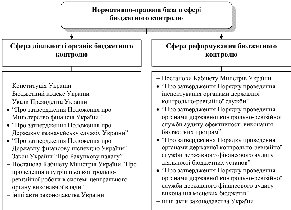
Рис. 2. Нормативно-правова база в сфері бюджетного контролю