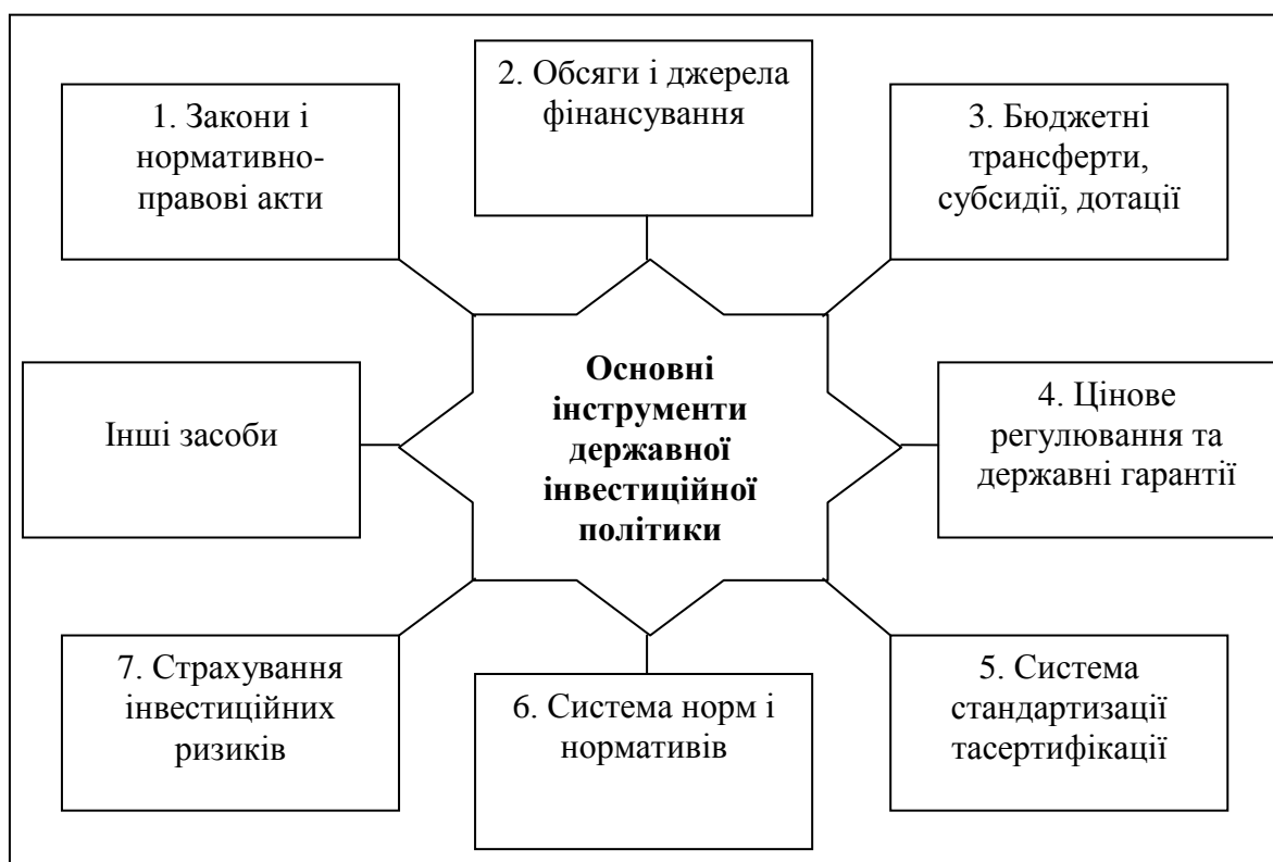
Рис. 2. Інструменти державної інвестиційної політики

Незважаючи на те, що найбільш використовуваними засобами державного управління інвестиційними процесами є монетарна та фіскальна політика, останнім часом регулювання умов інвестиційної діяльності здійснюється за допомогою інших інструментів державної інвестиційної політики (рис. 2).