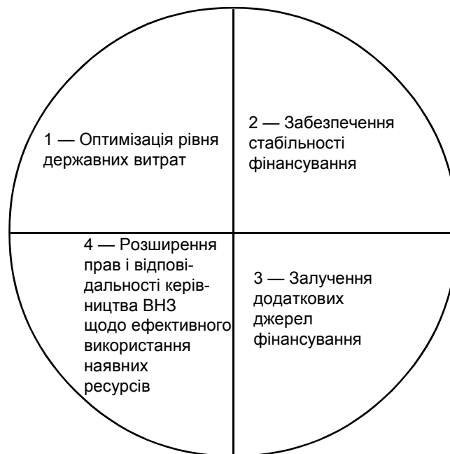
Схема 1. Складові розв'язання проблеми фінансування вищої освіти України

Наразі, коли ринок праці заповнений фахівцями з будь-якого профілю, головним