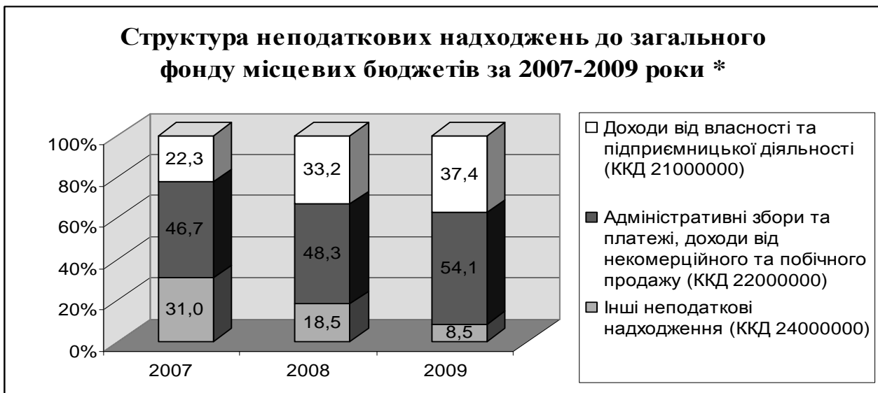
Рис. 2. Структура неподаткових надходжень до загального фонду місцевих бюджетів за 2007–2009 рр.*

В 2009 році порівняно з показниками 2008 року темпи приросту доходів від власності та підприємницької діяльності 4,1%, адміністративних зборів та платежів, доходів від некомерційного та побічного продажу – 3,5%, водночас, інші неподаткові надходження зменшилися на 57,2%.