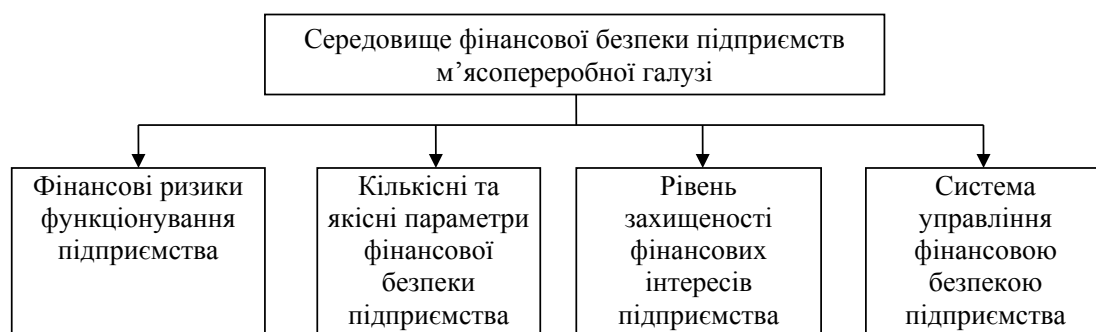
Рис. 1. Основні характеристики середовища фінансової безпеки підприємств м'ясопереробної галузі

Види фінансового середовища вітчизняних підприємств м'ясопереробної галузі, розглянуті в процесі здійснення аналізу системи фінансової безпеки, представлені на рис. 1.