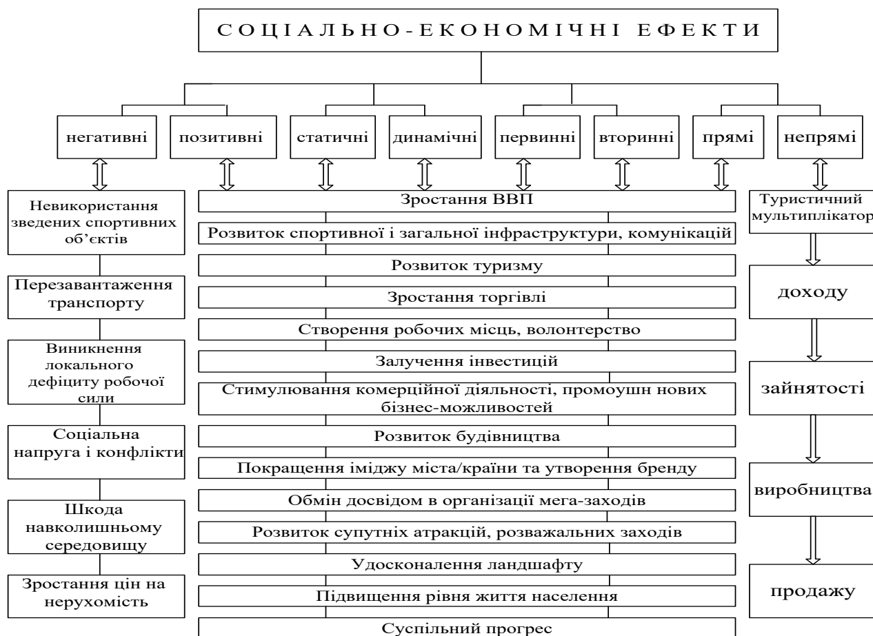
Рис. 1. Систематизація соціально-економічних ефектів від проведення міжнародних спортивних мега-заходів

позитивні характеристики таких методів як методи математичної статистики та теорії імовірностей, макро-, мезо-економічні моделі типу “вхід-вихід” на основі моделей міжгалузевого балансу Леонтьєва-Форда, які формуються для конкретних країн, регіонів, міст, що є місцем проведення міжнародних спортивних мега-заходів, їх використання і адаптація для інших країн, у тому числі України, є проблематичними через низку труднощів теоретичного і прикладного характеру. Враховуючи зазначене, автором запропоновано оцінювати соціально-економічні ефекти за допомогою методу сезонної декомпозиції, що дає змогу здійснювати моделювання трендів певних соціально-економічних показників і виявляти їх відхилення у результаті проведення міжнародних спортивних мега-заходів.