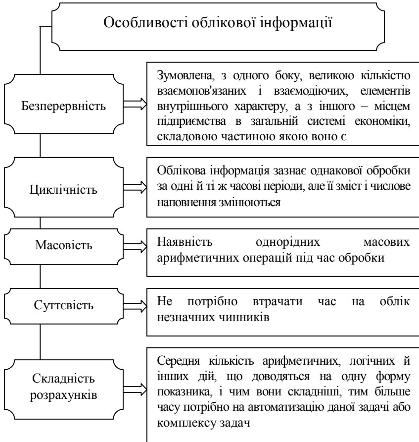
Рис. 2. Особливості облікової інформації

Для того, щоб облікова інформація однозначно сприймалась тими, хто брав участь в її підготовці в підприємстві і тими, хто її використовує, вона має відповідати певним вимогам (рис. 3).