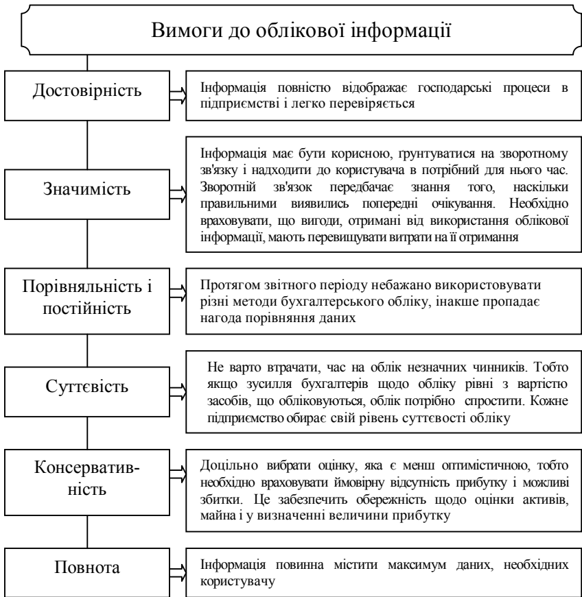
Рис. 3. Вимоги до облікової інформації [7]

Також на нашу думку інформацію можна поділити на: