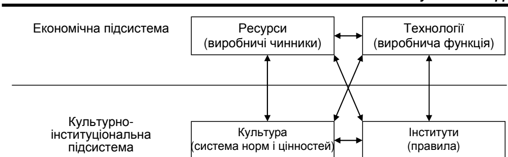
Рис. 2. Взаємозв'язок розвитку в соціальній системі [18, с. 11]

Економічний розвиток, як процес, має специфічні принципи, серед яких виділяють 7 класичних, сформульованих А. Смітом, Д. Рікардо, Д. Міллом, а саме: