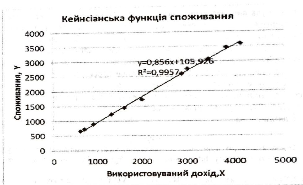
Рис. 1. Кейнсіанська функція споживання