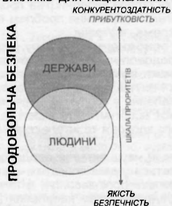
Рис. 1. Головні виміри суперечностей інноваційного розвитку у контексті забезпечення продовольчої безпеки.

Процеси глобалізації надали нового вигляду системам продовольчої безпеки у контексті суперечностей між безпекою держави і людини (рис. 1). За минулі декілька десятиліть суттєво зріс вплив регіональних і національних систем продовольчої безпеки на глобальному її рівні. Відповідно, сучасна система глобальної продовольчої безпеки, з одного боку, дає нові можливості для поліпшення здоров'я і благополуччя людства, а з іншого - стає джерелом нових загроз і викликів для національних систем.