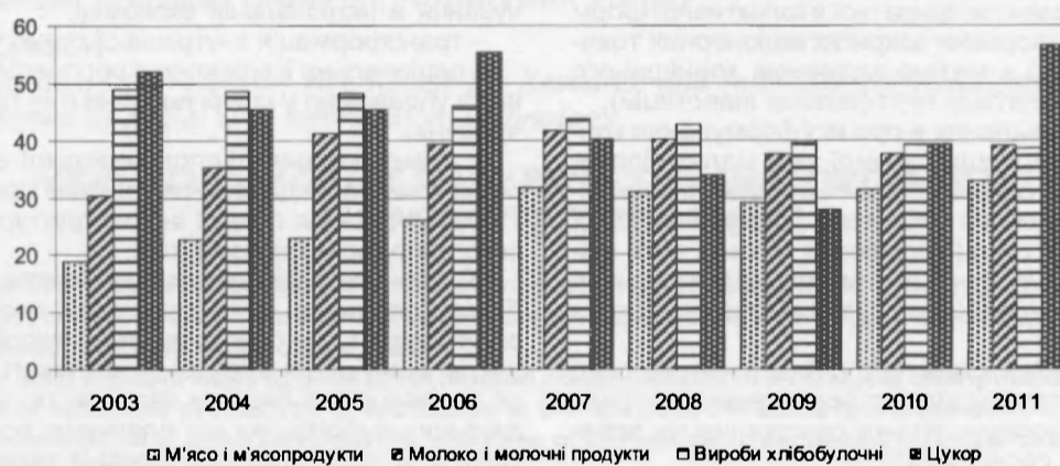
Рис. 4. Виробництво основних категорій продуктів харчування в Україні у 2003-2011 рр., кг на особу (за даними [3]).

ною тенденцією, що спостерігається у світовій практиці, є розвиток процесів диференціації потреб споживачів у відповідності до підвищення їх реальних доходів.