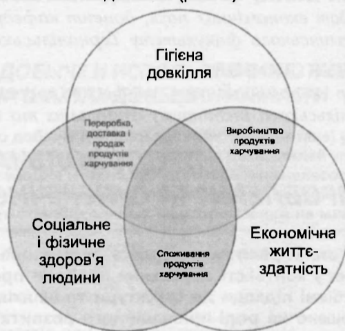
Рис. 2. Сталий розвиток сфери виробництва продуктів харчування [7].

єднанні трьох компонентів - гігієни довкілля, соціального та фізичного здоров'я людини, а також економічної життєздатності (рис. 2).