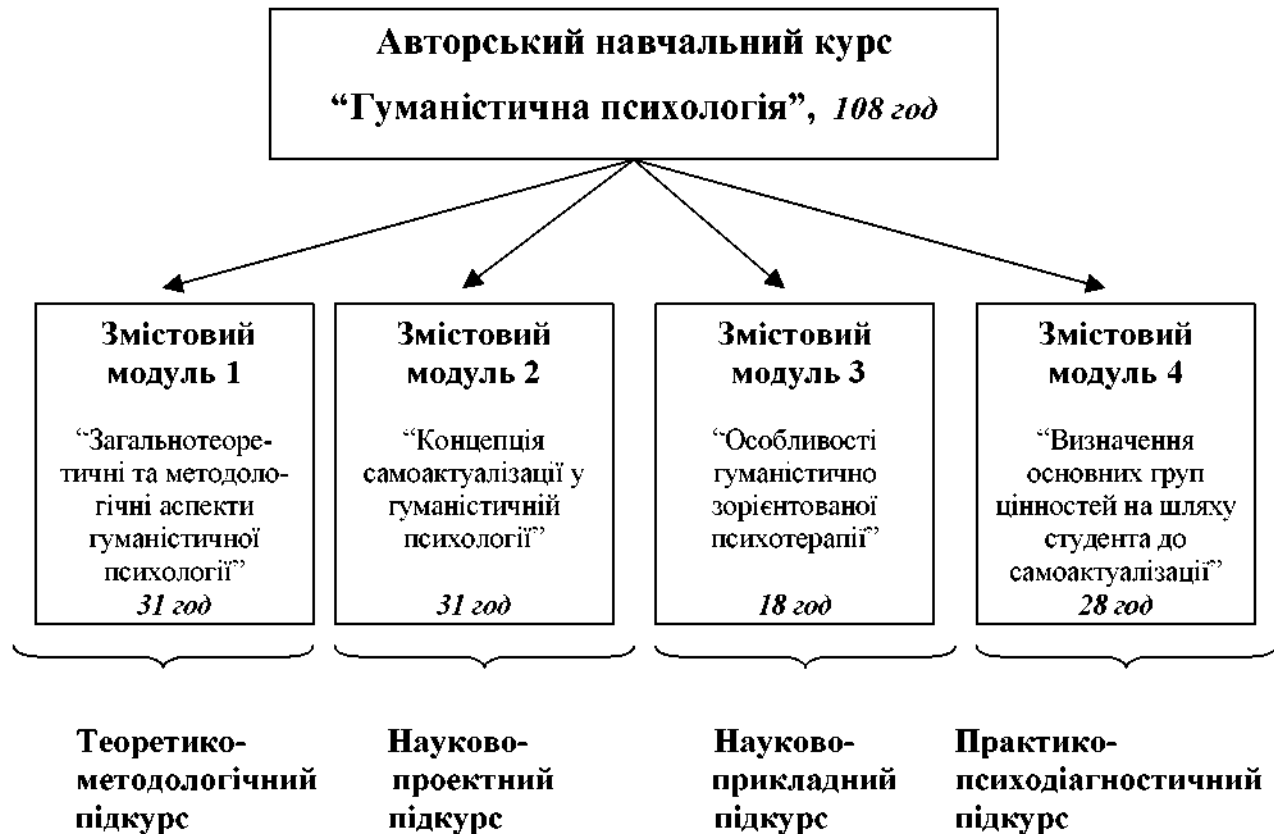
Рис. 1. Модульно-змістова структура авторського курсу

Крім того, нами розроблена та апробована граф-схема навчального курсу "Гуманістична психологія", що дає змогу долати традиційний дисбаланс між освітньо-академічними і буттєво-особистісними інтересами студентів, залучати їх до наукового проектування і психодіагностичного практикування (рис. 2). Граф-схема побудована на основі авторських концептуальних положень (див. Фурман А.В. Модульно-розвивальне навчання: принципи, умови, забезпечення: Монографія. – К.: Правда Ярославичів, 1997. – 340 с.), а саме: