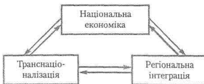
Рис. 3 Детермінанти світогосподарського розвитку на інтеграційній стадії інтернаціоналізації

На сучасному етапі економічний розвиток зумовлено як процесами транснаціоналізації, так і процесами регіональної економічної інтеграції. Як зазначає Лук'яненко Д. Г., взаємовідносини країн розвиваються у трикутнику «національні економіки — транснаціоналізація — регіональна інтеграція» (рис.3).