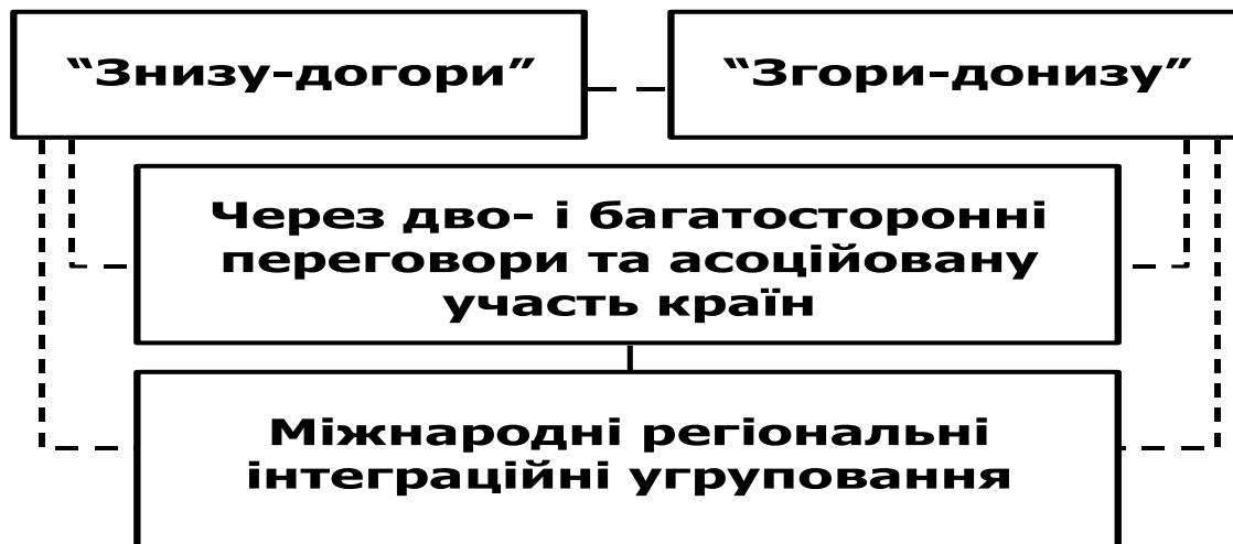
Рис. 2 Шляхи формування міжнародних регіональних інтеграційних угруповань

В цілому послідовний розвиток форм міжнародної регіональної економічної інтеграції забезпечує найбільш повне, найбільш раціональне використання економічного потенціалу країн та підвищення темпів їх розвитку.