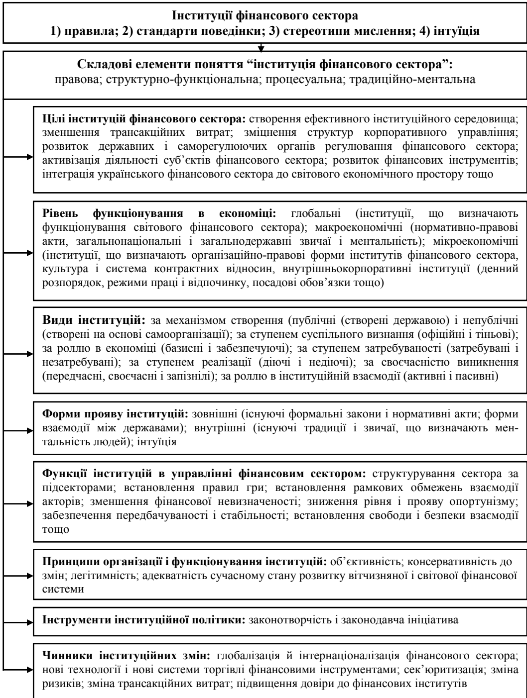
Рис. 1. Понятійно-методологічна модель інституцій фінансового сектора