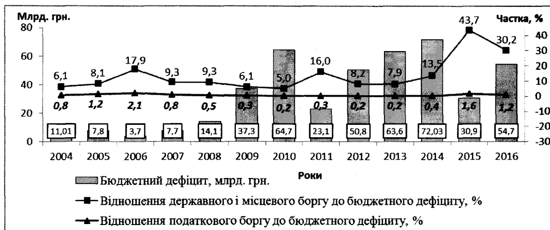
Рис. 4. Динаміка дефіциту бюджету держави та відношення податкового боргу України та державного і місцевого боргу до дефіциту бюджету держави у 2004–2016 рр. [складено авторами на основі даних [6–9]]

Активне використання позикового методу формування бюджетних коштів призвело до значного переважання обсягу державного і місцевого боргу над дефіцитом бюджету держави – з 6,1 разу у 2004 р. до 30,2 разу у 2016 р. Крім того, починаючи із 2014 р. спостерігається перевищення частки державного і місцевого боргу у ВВП на 1,18% та 8,16% у 2015 р. над критичним рівнем співвідношення боргу до ВВП – 60%, визначеним Маастрихським договором та критеріями Міжнародного валютного фонду, що є загрозою борговій безпеці України.