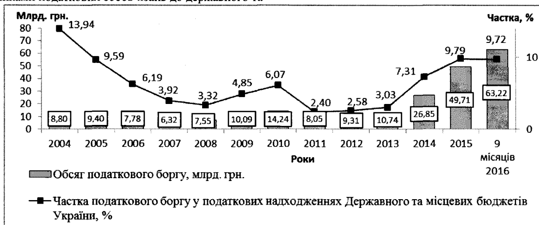
Рис. 2. Динаміка обсягу податкового боргу та його частки у податкових надходженнях до Державного та місцевих бюджетів України у 2004–2016 рр.

Динаміка податкового боргу України та відношення його обсягу до податкових надходжень бюджету держави відображена на рис. 2.