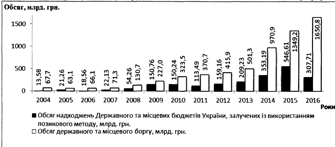
Рис. 3. Динаміка державного і місцевого боргу України та обсягу надходжень бюджету держави, залучених позиковим методом у 2004–2016 рр. [складено авторами на основі даних [7; 8]]

відношення державного і місцевого боргу до зазначеного показника, відображена на рис. 4, дає підстави стверджувати, що зростання бюджетного дефіциту з 11,01 млрд. грн. у 2004 р. до 54,7 млрд. грн. у 2016 р. зумовило необхідність пошуку джерел його покриття, зокрема – залучення внутрішніх і зовнішніх запозичень, обсяг яких щороку зростає.