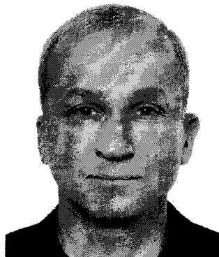
к.е.н., доцент, декан факультету фінансів, Тернопільський національний економічний університет