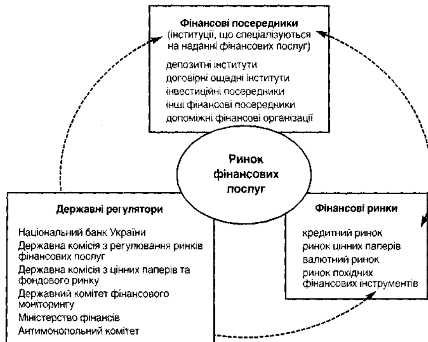
Рис. 2. Організаційно-інституційна структура ринку фінансових послуг

ринку фінансових послуг. Іншими словами, сфери надання фінансових послуг професійними учасниками фінансового ринку утворюють ринок фінансових послуг. Саме в цьому проявляється особлива система взаємозв'язків фінансового ринку та ринку фінансових послуг, що призводить до їх ототожнення (рис. 2).