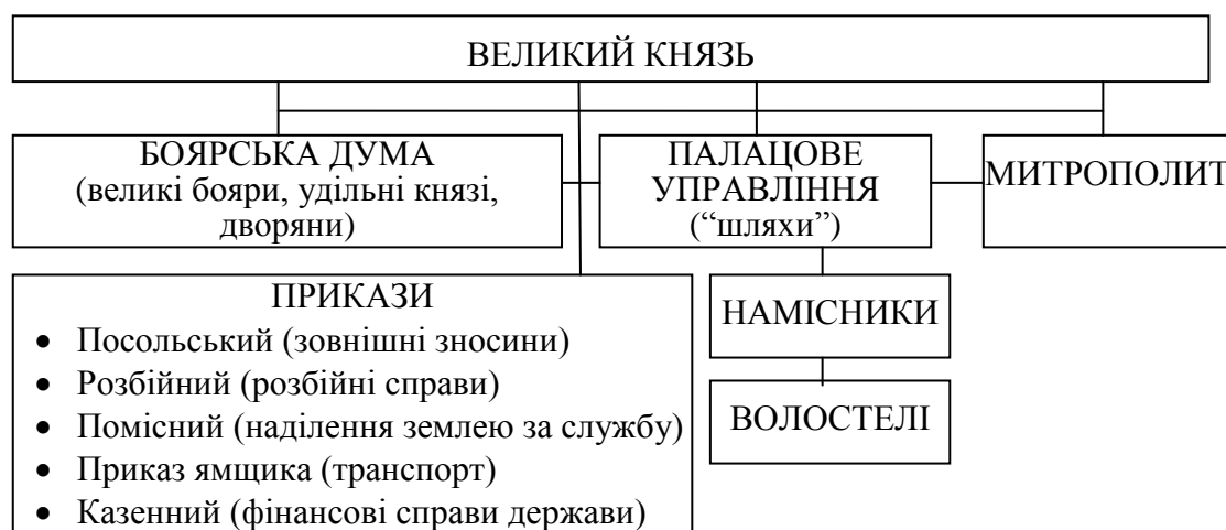
Схема. Державний механізм Великого князівства московського

Творчі завдання розраховані на вміння студента аналітично підходити до вивчення державного устрою, суспільного ладу чи системи права у певній державі в конкретно визначений період, відтворювати здобуті знання у логічно-схематичній формі, тобто у вигляді схем чи порівняльних таблиць.