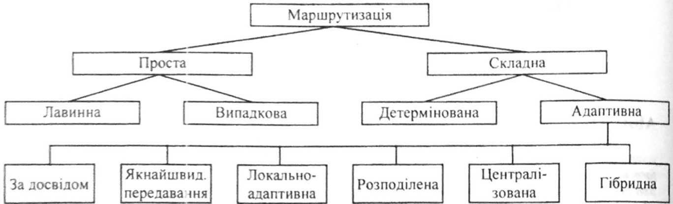
Рисунок 2. Класифікація методів маршрутизації.

Необхідною умовою, яка сприяє успішному розв'язанню задач складної маршрутизації, є визначення величини інформаційних потоків на різних ділянках мережі з метою формування таблиць маршрутизації. Дані про величини інформаційних потоків можуть бути отримані як апіорно, так і на основі вимірювання певних параметрів (кількості інформації, затримок передавання інформації). Однак процес вимірювання інформаційних потоків та регулярний обмін вузлами службовою інформацією між собою чи з центральною інстанцією відбирає значну частину ресурсів мережі і викликає додатковий трафік маршрутизації, який іноді досягає 50% корисного трафіка [1]. Це призводить до різкого зниження ефективності маршрутизації в цілому. У зв'язку з цим виникає задача оптимізації кількості контрольних точок, в яких проводиться вимірювання інформаційних потоків, з метою зменшення додаткового службового трафіка.