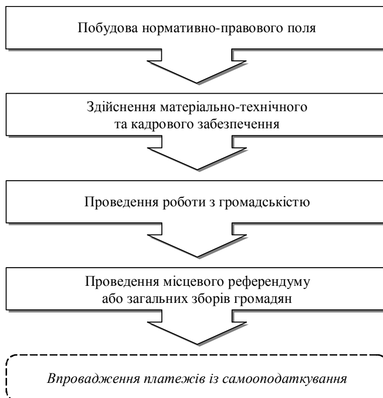
Рис. 3. Напрями поширення в Україні практики самооподаткування мешканців територіальних громад [10, 34]

Вважаємо, що поширити в Україні практику самооподаткування мешканців територіальних громад потрібно за напрямами, узагальненими на рис. 3.