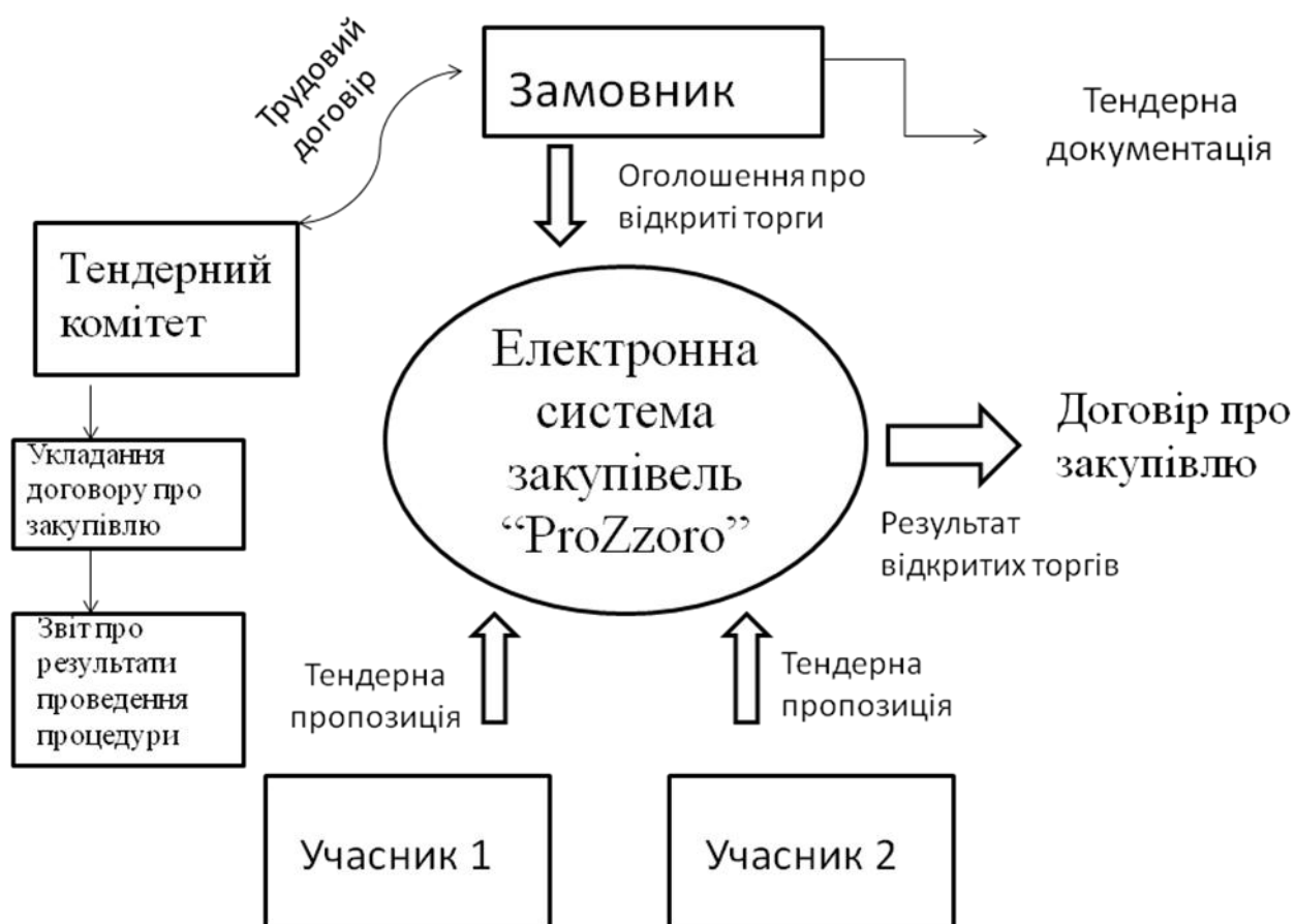
Рис. 1 Процедура відкритих торгів

на державні закупівлі – це кошти державного і місцевого бюджетів. Отже, ми можемо зробити висновок, що за допомогою системи «ProZorro» вдалося зробити витрачання коштів більш прозорим та збільшити ефективність їх витрачання. Придбання робіт, товарів та послуг у системі «ProZorro» відбувається наступним чином рис.1