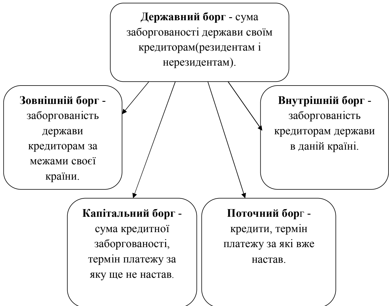
Рис. 2.1. Структура державного боргу

Відповідно до статті 2 Бюджетного кодексу України, державний борг - загальна сума боргових зобов'язань держави з повернення отриманих та непогашених кредитів (позик) станом на звітну дату, що виникають внаслідок державного запозичення [3].