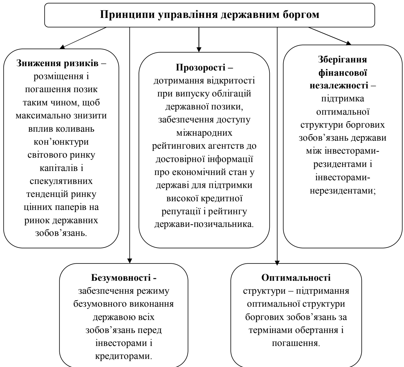
Рис. 3.1. Принципи управління державним боргом

Для ефективного управління держборгом необхідно дотримуватись основних принципів, які відображені на рис. 3.1.