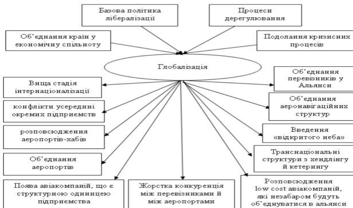
Рис 1.1. Напрямки глобалізації

Глобалізація як явище виникла ще в період Нового часу. Термін «глобалізація» походить від англійських слів «globe» – земна куля, «global» – світовий, всесвітній [7, с. 170]. Термін епізодично застосовувався впродовж багатьох десятиліть, проте лише на початку 60-х років ХХ ст. це поняття було введено в широкий науковий обіг. Згідно з визначенням Міжнародного валютного фонду, глобалізація – це «вільне пересування потоків ідей, людей, благ, послуг і капіталів, що ведуть до все більш зростаючої інтеграції економіки і суспільства» [10, с. 112], але сьогодні прогрес глобалізації вже «охоплює не тільки економіку, сферу підприємницької діяльності, але і політичну, і соціальну сфери» [10, с. 124]. А. Панарін вважає, що «глобалізацію можна визначити як процес ослаблення традиційних територіальних, соціокультурних і державно-політичних бар'єрів (ізолюючих народи один від одного і в той же час оберігаючих їх від неврегульованих зовнішніх дій) та становлення нової, «безпротекціоністської системи» міжнародної взаємодії і взаємозалежності» [13, с. 149].