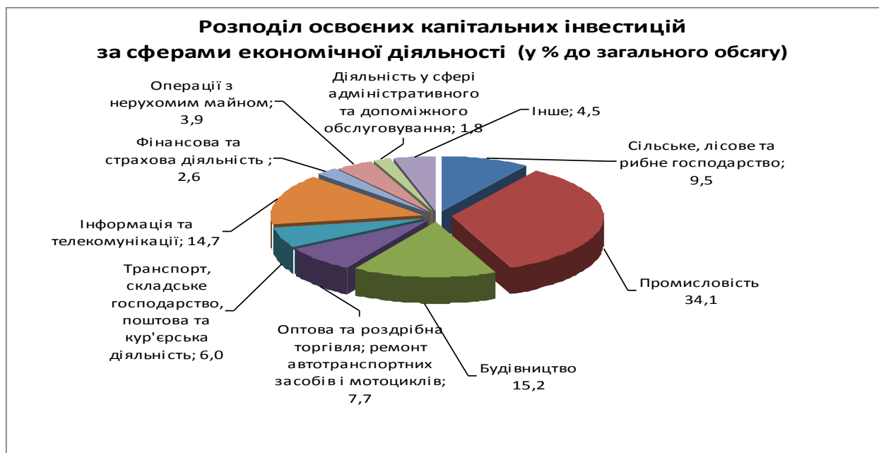
Рис. 2.2. Розподіл освоєних капітальних інвестицій за сферами економічної діяльності (у % до загального обсягу) [2]

Головним джерелом фінансування капітальних інвестицій, як і раніше, залишаються власні кошти підприємств та організацій, за рахунок яких у січні – червні 2015 року освоєно 69,3 відсотка капіталовкладень.