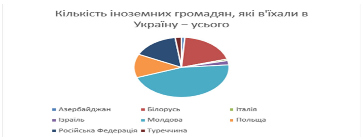
Рис. 4 В'їзд іноземних громадян в Україну за країнами, з яких вони прибули, у 2016 році

Щодо регіональної структури надходження туристичних потоків, то головним джерелом були росіяни. У 2013 році Україну відвідало 10.3 млн. жителів Росії. У 2017 році цей показник значно скоротився, досягнувши позначки лише у 1.5 млн. росіян.