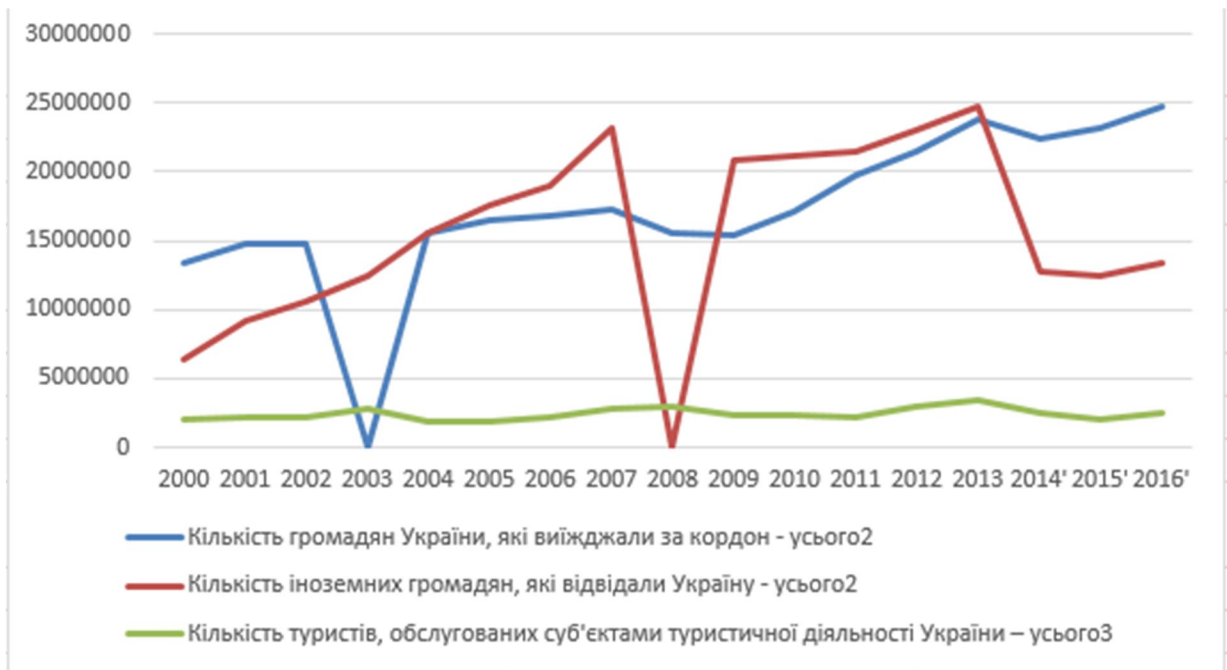
Рис.2 Туристичні потоки.