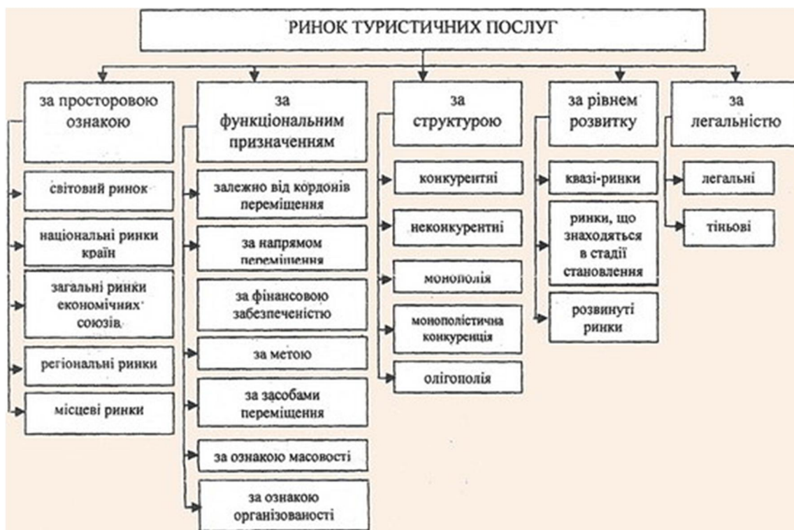
Рис.1 Класифікація ринку туристичних послуг [6]

Розкриття сутності будь-якого ринку передбачає визначення його структури.