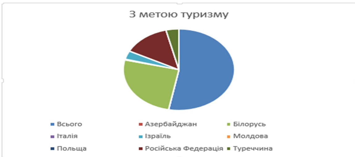
Рис. 5 Частка іноземних громадян, що прибули в Україну з метою туризму у 2016 році