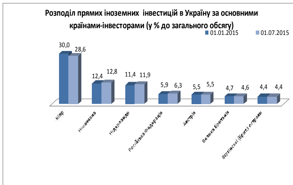
Рис.2.3 Розподіл прямих іноземних інвестицій в Україну за основними країнами-інвесторами (у % до загального обсягу)

складають Кіпр – 12274100000 $, Німеччина - 5489,0 млн. $, Нідерланди - 5108,0 млн. $, Російська Федерація - 2685600000. $. Австрія – 2354300000 $, Великобританія – 1953900000 $, Віргінські Острови (Великобританія) – 1872600000$, Франція – 1539200000 $, Швейцарія – 1371200000 $ та Італія – 966600000 $ .