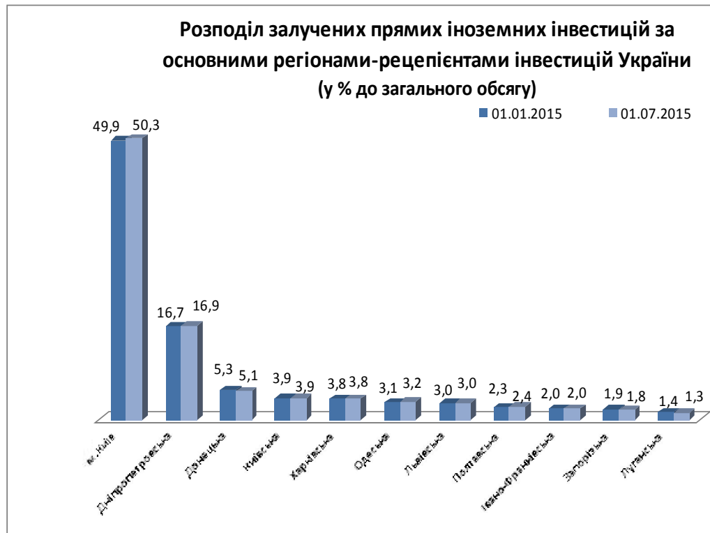
Рис.2.4 Розподіл прямих іноземних інвестицій за регіонами