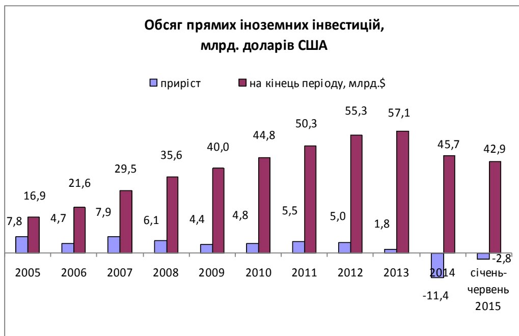
Рис.2.2 Обсяг прямих іноземних інвестицій, млрд. дол.

показано на рис. 2.2. у 2015 р. практично нічого не змінилося в порівнянні з 2012-2014 рр. – 2,51 балів із 5. Найвищий Індекс інвестиційної привабливості України був у 2011 році – 3,4 пункти, а потім він поступово зменшувався. Найнижче значення було зафіксовано в 2013 році. І у 2016 році інвестиції мали тенденцію до зменшення.