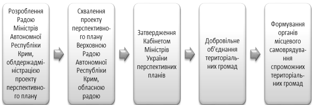
Рис. 1. Етапи формування спроможних територіальних громад*

Лідерами процесу об'єднання у 2015 р. стали Тернопільська та Хмельницька області, де, відповідно, утворено 26 та 22 громади. Проте жодної нема у Харківській області (рис. 2). Загальна площа всіх ОТГ становила 35807 км 2 6% від площі України (без урахування м. Києва та Автономної Республіки Крим). Найбільша за площею ОТГ – Народицька ОТГ Житомирської області, яка займає 1284 км 2 , найменша – Міженецька ОТГ Львівської області – 8,7 км 2 . Станом на 1 січня 2016 року чисельність населення, яке мешкало на території цих ОТГ, становила 1386,5 тис. осіб, що складає 3,8% від загальної чисельності населення України (без урахування м. Києва та Автономної Республіки Крим). Об'єднані територіальні громади суттєво відрізняються і за чисельністю населення. Найменша – Макіївська ОТГ Чернігівської області – 1,6 тис. жителів, найбільша – Лиманська ОТГ Донецької області – 44,2 тис. жителів (громада створена на основі міста-району) [4].