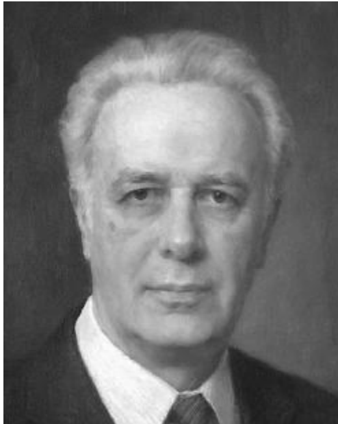
Володимир РОМЕНЕЦЬ (1926–1998)

диктату об'єктивізму, метафізики, модерного світобачення людини, її місця і ролі у світі. Психологи говорять про особистість та її свободу, пишуться тим, що "подолали"